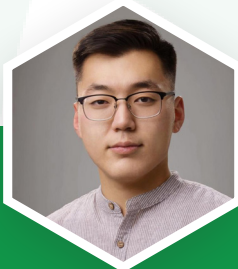
О.БАЯРТ ТУСЛАХ АУДИТОР

Мэргэшсэн Нягтлан Бодогч Татварын Мэргэшсэн Зөвлөх