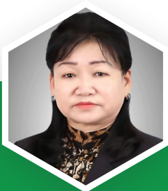
Г.ОЮУН АХЛАХ АУДИТОР